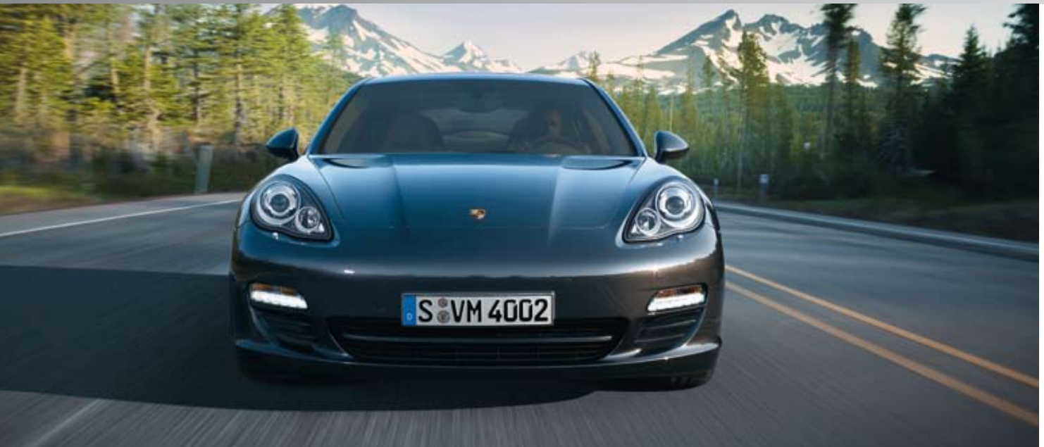
Der Panamera bei seiner Weltpremiere in Shanghai am 19. April 2009.